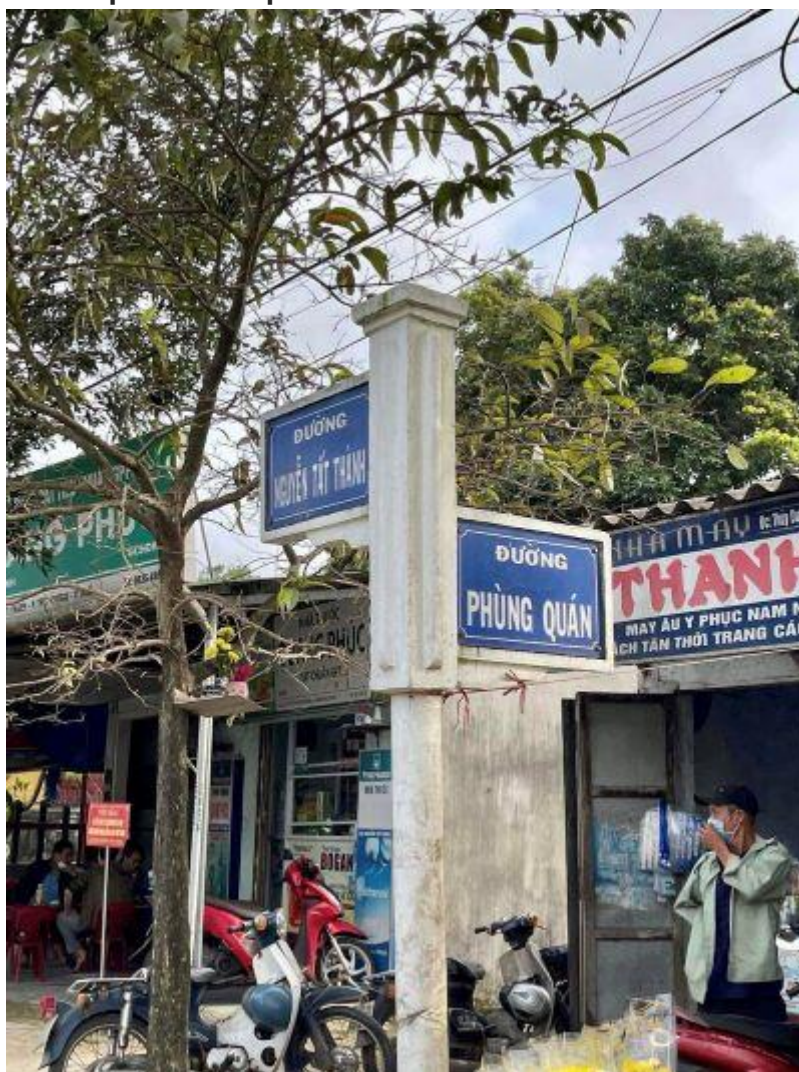
Đường Phùng Quán ở Thủy Dương (Huế) cạnh đường Nguyễn Tất Thành.

Nhân chuyện này liên hệ với Huế tôi thấy thú vị thật nhức với cổ đô. Nhà thơ Phùng Quán bị nạn Nhân Văn – Giai Phẩm thế nào ai cũng đã biết. Nhưng khi ông được phục hồi, được trao Giải thưởng Nhà nước về VHNT, thì tại phường Thủy Dương (Huế) quê hương ông, chính quyền thành phố đã lấy tên ông đặt cho một con đường dài hơn ba cây số. Con đường đó bắt ra đường lớn mang tên Nguyễn Tất Thành Thành chạy từ thành phố về phía Nam.